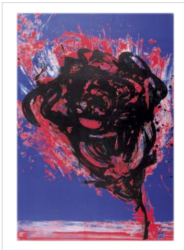
Otto Piene. Schwarze Rose. 1978. Farbsiebdruck