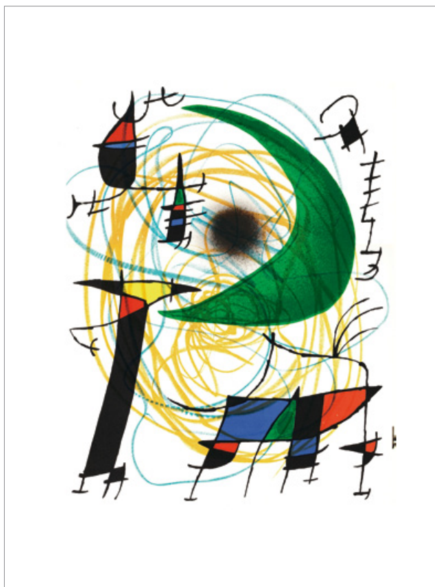
Joan Miró. Farblithografie. 1972

kunst-a-bunt.de wikipedia.org/wiki/Der_Querschnitt